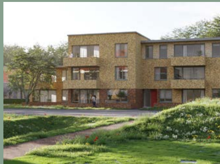
< Elias Beekmankazerne Ede