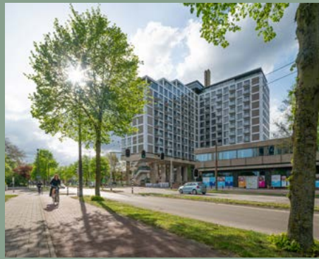
< High Park Arnhem