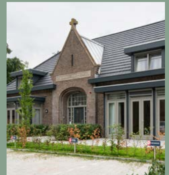
^ Huize Willibrordus Ruurlo