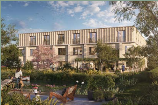
^ Grote Lijster Uithoorn