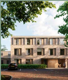
Glipperdreef > Heemstede